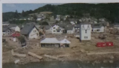
Ortsbild Gemeinde Schuld